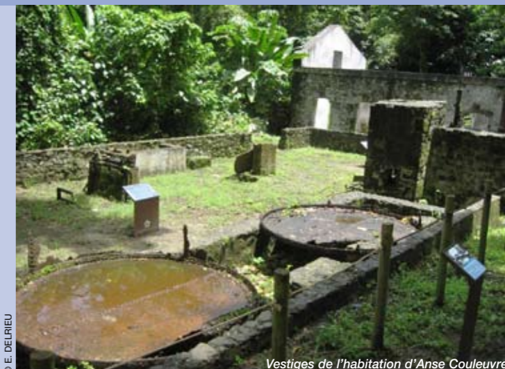
Vestiges de l'habitation d'Anse Couleuvre

Situé entre le Prêcheur et Grand-Rivière, ce site forme une entité naturelle exceptionnelle pour les Petites Antilles. Plus de 200 espèces d'arbres y ont été recensées, soit plus de la moitié de toutes les espèces de l'île! Y subsistent également des vestiges d'habitations coloniales. Entre le XVII e et le début du XX e siècle, plusieurs d'entre elles développèrent des activités agro-industrielles: sucre, rhum, café, cacao, huiles essentielles... Des travaux de conservation et de valorisation de ce patrimoine culturel ont été engagés à Anse Couleuvre et Fond Moulin, initiés dans le cadre d'un chantier d'insertion afin d'allier utilité économique et sociale.