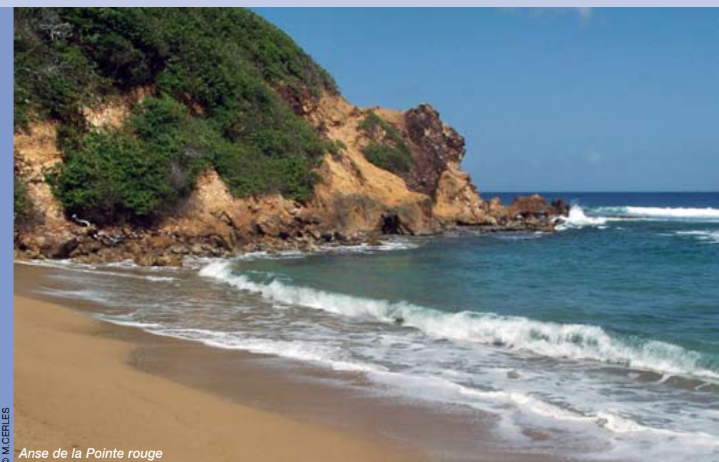
Anse de la Pointe rouge

Depuis plus de trente ans, le Conservatoire du littoral a pour mission de préserver définitivement des sites naturels le long des rivages de métropole et d'outre-mer. Pour cela, il acquiert des espaces, qu'il remet ensuite en gestion aux collectivités locales et aux associations qui les entretiennent, avec l'aide des usagers (éleveurs, agriculteurs, chasseurs, etc.). À ce jour, le Conservatoire préserve plus de 25000 hectares en outre-mer, répartis sur 150 sites naturels, dans 4 départements - La Réunion, Guadeloupe, Martinique, Guyane - et 4 collectivités - Mayotte, Saint-Pierre-et-Miquelon, Saint-Martin et Saint-Barthélemy.