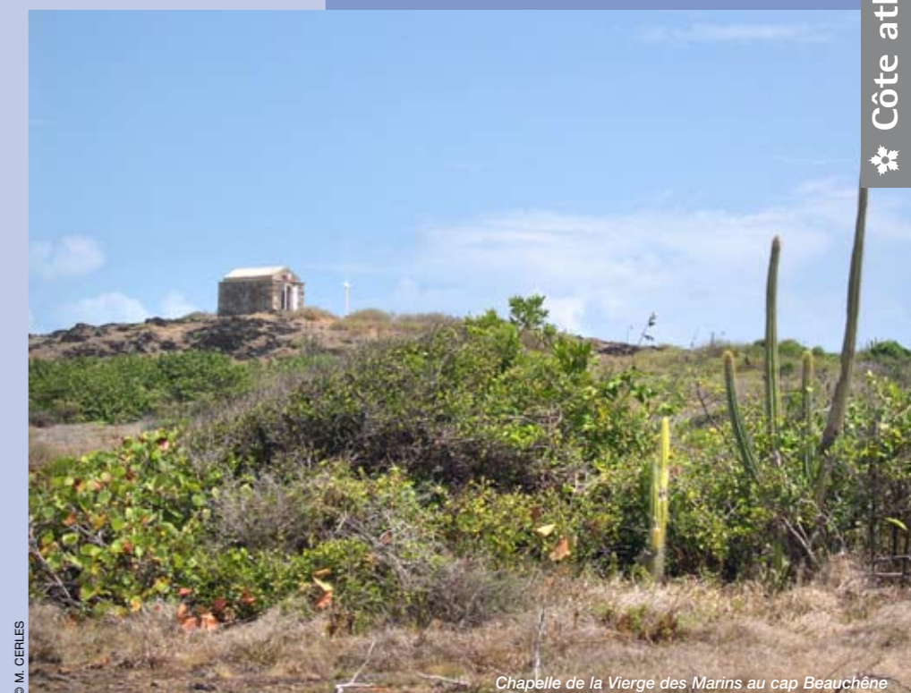
Chapelle de la Vierge des Marins au cap Beauchêne