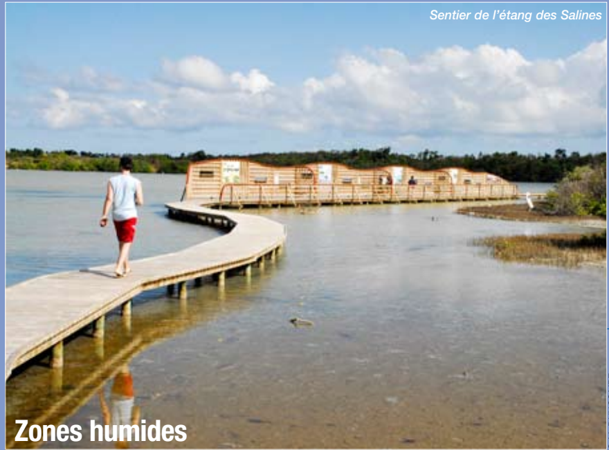
Sentier de l'étang des Salines