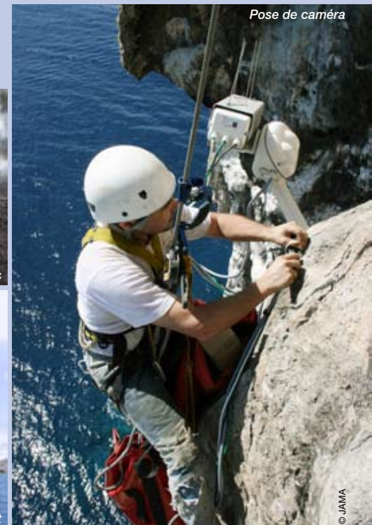
Pose de caméra