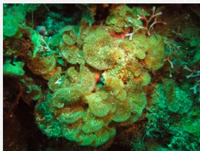
Une algue brune fréquente sur nos récifs ( Lobophora variegata )

Certaines espèces peuvent également sécréter un "squelette calcaire". Vous pouvez faire sentir la rigidité de la plante en la faisant toucher en plongée. Ces algues calcifiées sont assez fréquentes sur les fonds rocheux et les fonds sableux. Elles ont un rôle important dans la fabrication du sable de nos plages comme tous les organismes qui comportent une partie calcaire (lorsqu'elles meurent, elles sont peu à peu réduites à l'état de grain de sable). Cette calcification les protège des prédateurs.