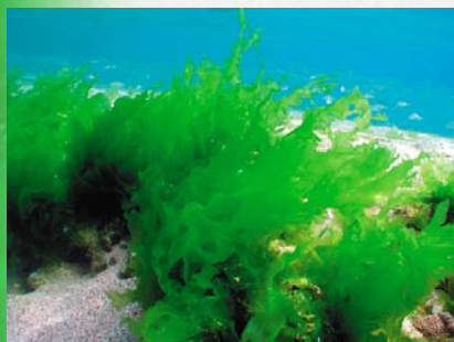
Une algue verte fréquente sur les bords de plage : L'ulve ( Ulva sp)

Les algues sont des plantes assez rudimentaires. Elles n'ont pas de parties bien différenciées comme les plantes terrestres (avec une tige, des feuilles, des fleurs..) et n'ont pas de vaisseaux conducteurs. Elles sont composées d'une lame de cellules (parfois organisées en plusieurs couches) appelée "thalle" plus ou moins ramifiée et sont généralement accrochées au support par un crampon. Selon les pigments dominants, elles peuvent être brunes, rouges ou vertes.