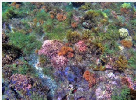
Les algues brunes et rouges calcifiées colonisent les fonds rocheux sur les côtes rocheuses à l'anse chaude

Comme pour tous les organismes vivants, le développement des végétaux est régulé par les facteurs de l'environnement, notamment la disponibilité en nourriture. Les algues ont besoin de nutriments pour fabriquer leur matière vivante (azote et phosphore dissous dans l'eau de mer). Dans les régions tropicales, les eaux sont naturellement pauvres en minéraux. De ce fait, leur croissance est limitée. Par contre, dès que les concentrations en éléments nutritifs augmentent, les algues peuvent se développer au détriment des autres organismes. Ce phénomène est nettement visible sur presque toutes les côtes martiniquaises où l'on observe un très net développement des algues. Ce développement est en partie dû à un enrichissement des eaux en éléments nutritifs comme nous le verrons dans les cours ultérieurs.