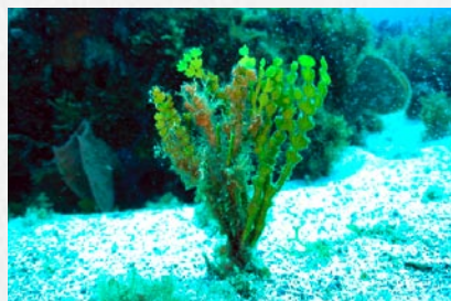
Une algue verte calcifiée fréquente sur les fonds sableux et souvent associée aux phanérogames marines : Halimeda incrassata

Certaines espèces peuvent également sécréter un "squelette calcaire". Vous pouvez faire sentir la rigidité de la plante en la faisant toucher en plongée. Ces algues calcifiées sont assez fréquentes sur les fonds rocheux et les fonds sableux. Elles ont un rôle important dans la fabrication du sable de nos plages comme tous les organismes qui comportent une partie calcaire (lorsqu'elles meurent, elles sont peu à peu réduites à l'état de grain de sable). Cette calcification les protège des prédateurs.