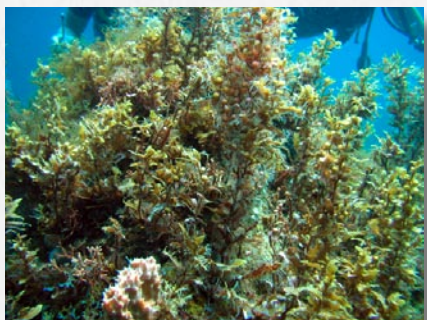
Sargasse ( Sargassum sp.)

Les algues molles, qui ne bénéficient pas de cette protection physique, ont développé pour certaines des protections chimiques par la sécrétion de composés difficilement assimilables par leurs prédateurs (comme les chirurgiens). C'est notamment le cas des espèces de Sargasse.