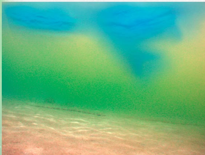
Bloom algal

Ce sont des cellules végétales libres dans l'eau. Elles composent la fraction végétale du plancton* ou "phyto-plancton". Elles sont invisibles à l'œil nu. Lorsque la concentration des éléments minéraux dans l'eau augmente, ces micro-algues se multiplient et peuvent former des marées vertes ou "bloom algaux". Vous pouvez observer ce phénomène en période de pluie et de chaleur autour de la Martinique.