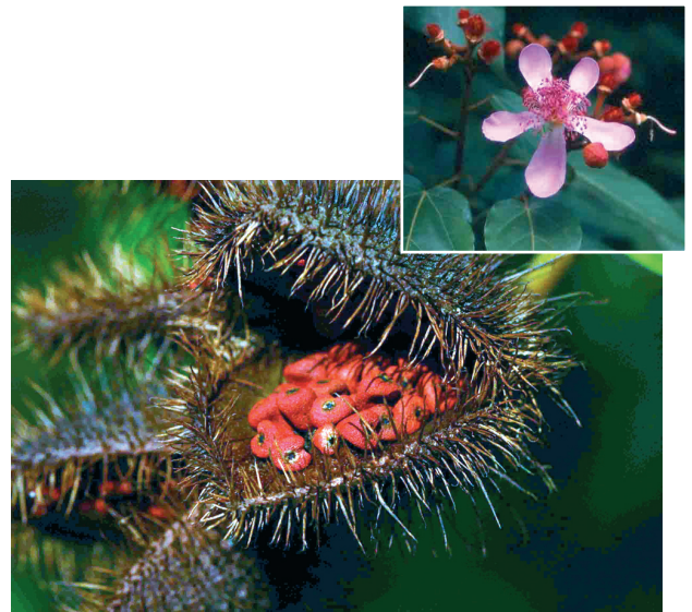
« Roucou » Bixa orellana L. BIXACEAE Originaire d'Amérique continentale tropicale, introduit par les Amérindiens qui utilisaient les graines rouges en teinture corporelle.

Jacques FOURNET (2002) dénombre 1 536 espèces considérées comme indigènes à la Guadeloupe et à la Martinique, pour un recensement de 3 200 espèces au total.