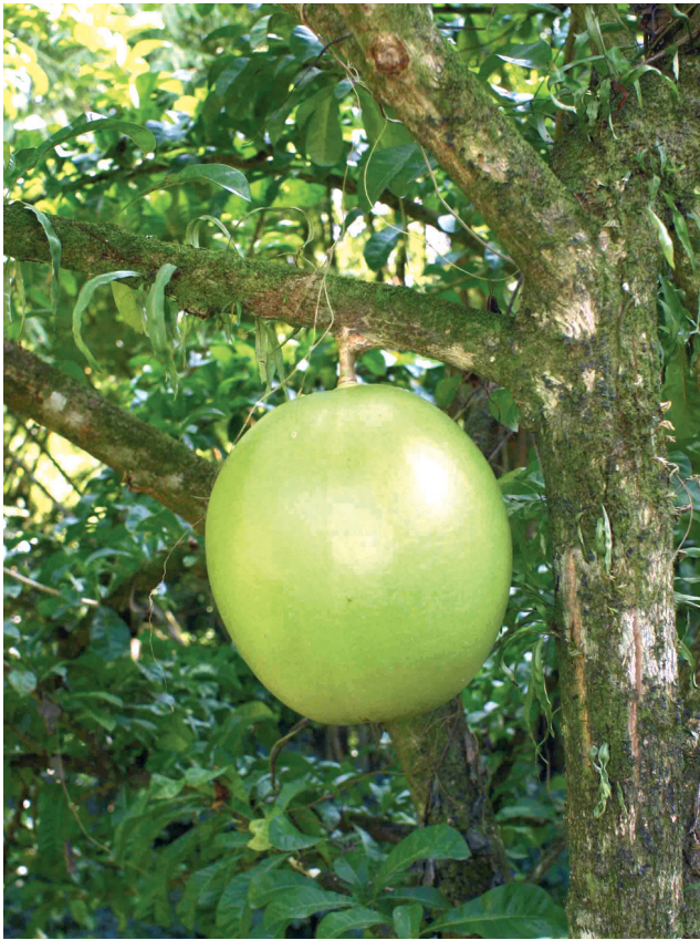
«Calabasse» Crescentia cujete L. BIGNONIACEAE. Originaire d'Amérique tropicale. Divers ustensiles, dont les «couis*», étaient fabriqués par les Amérindiens à partir des fruits évidés (formes variées).