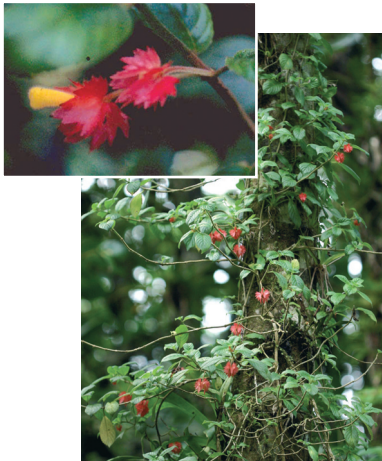
« Crête de coq, Fuschia sauvage » Alloplectus cristatus (L.) Martius GESNERIACEAE