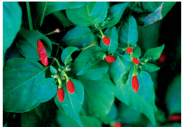
«Piment, Piment z'oiseau» Capsicum frutescens L. SOLANACEAE.