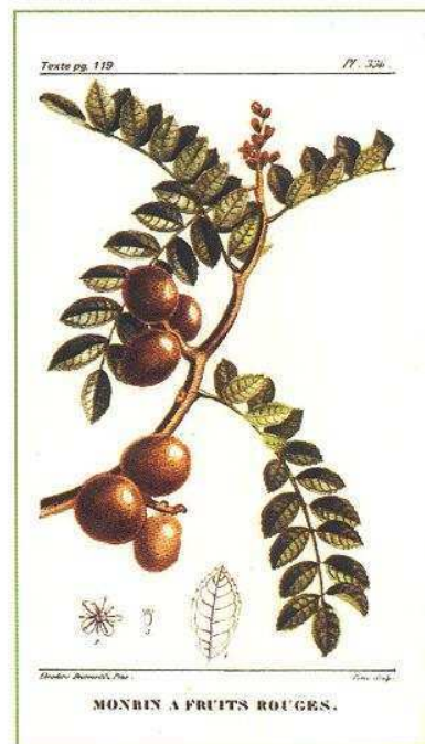
« Prune d'Espagne » Spondias purpurea L. ANACARDIACEAE Extrait de DESCOURTILZ (1820-1831)

La règle de priorité veut que le binôme publié le plus ancien, à partir de 1753, soit reconnu comme seul valable : les autres binômes deviennent alors des synonymes.