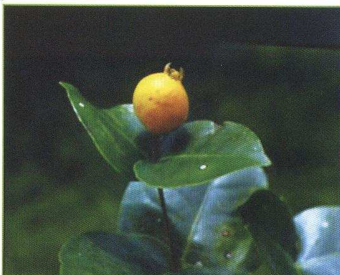
«Goyavier bâtard» Eugenia gryposperma Kr. & Urb. ex Urb., MYRTACEAE Endémique stricte des environs de la Montagne du Vauclin (Martinique).