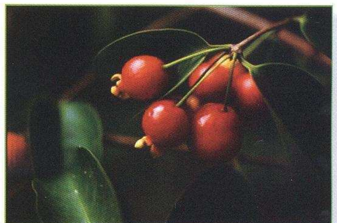
«Goyavier bâtard» Eugenia pseudopsidium Jacq., MYRTACEAE Forêt des zones moyennement humides Présent dans toutes les Petites Antilles