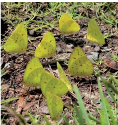
Piérides des jardins ( Phoebis sennae ) Cliché Eddy Dumbardon-Martial

Les taillis et les forêts sèches sont souvent occupés par la belle « Feuille morte » ( Memphis verticordia luciana , Lép. Nymphalidé) à peine visible dans la végétation et qui se délecte, durant les heures les plus chaudes de la journée, des exsudats de végétaux. Les clairières et prairies sont le point de rencontre de moult papillons diurnes de cou-