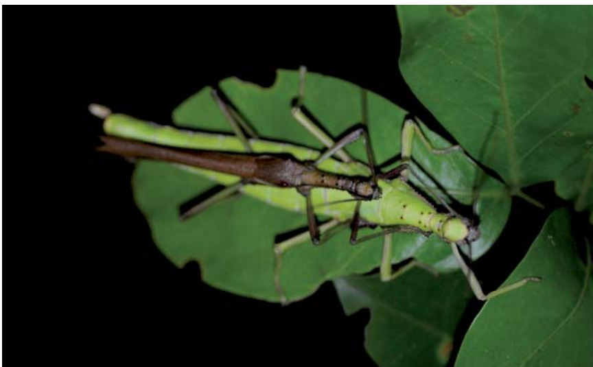
Accouplement de Diapherodes martinicensis .