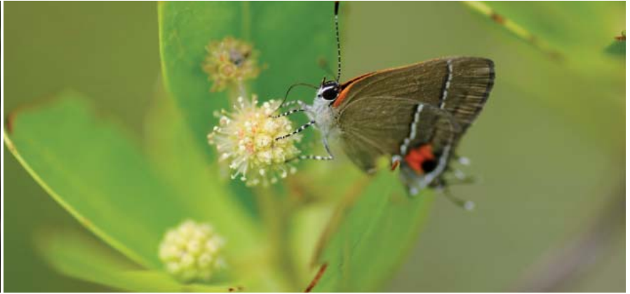
Une « Feuille morte » se nourrissant de l'exsudat d'un campêche. À droite, le Lycène Electrostymon angerona en pleine activité de butinage.

des caps », tout aussi prisées par les touristes que par les résidents. Elles sont fréquentées par diverses espèces de guêpes qui s'attèlent durant une bonne partie de la journée à construire et entretenir leurs nids ou à chasser de petits arthropodes. C'est le cas de la guêpe des sables ( Stictia signata , Sphécidé) qui affectionne particulièrement les plages du sud de l'île. Elle creuse sans relâche de petits terriers qu'elle alimente de divers insectes capturés qui serviront de nourriture à sa progéniture.