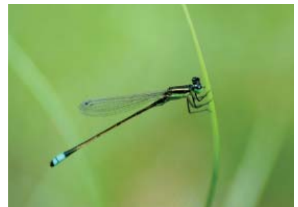
Ischnura ramburii (Coenagrionidé)

végétation d'espèces succulentes, coriaces, poïkilohydres remarquablement résistantes aux sécheresses les plus rudes. Loin d'être découragée par ces conditions, la mygale Acanthoscurria antillensis y a établi domicile et bien qu'elle puisse paraître discrète, il n'est pas rare de la surprendre à l'entrée d'un de ses courts terriers qu'elle prend soin de creuser sous les pierres ou sous d'immenses troncs d'arbres tombés au sol. Elle s'y tient à l'affût et malheur aux petits insectes et vertébrés qui se risquent à traîner des pattes dans les environs. Il en est pourtant un qui ose le faire ! Le grand Pompile Pepsis grossa , connu localement sous le nom de « Mouche brûlante », remarquable