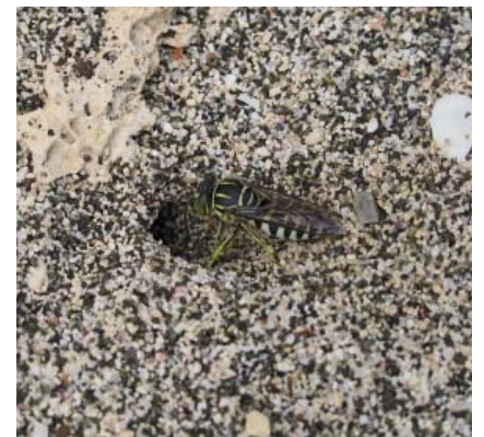
Guêpe des sables creusant activement un terrier en arrière-plage

Accostons donc d'abord sur les plages de sable blanc de la « Trace