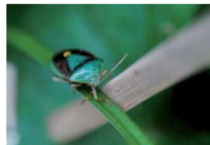
Edessa bifida .