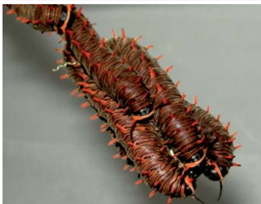
Ci-dessus, Battus polydamascebriones en train de pondre et ses chenilles.