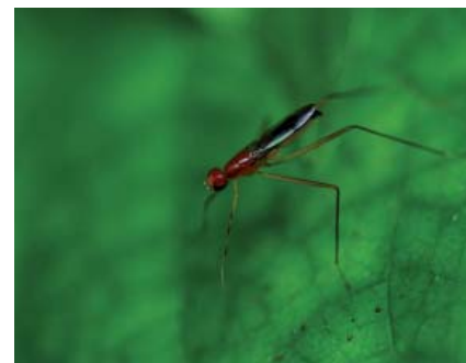
Grallipeza sp.