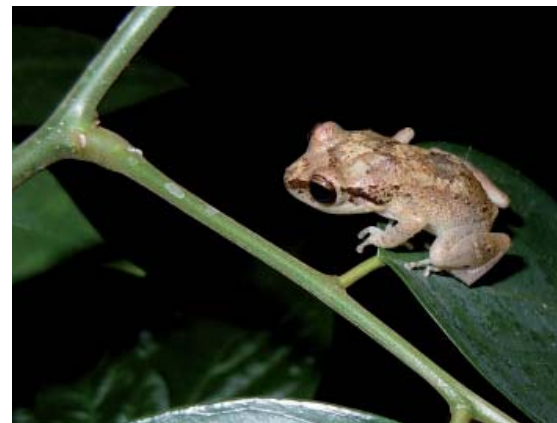
Hylode de Johnstone.

étages de la végétation et les milieux perturbés (naturellement ou non). Elle s'y nourrit principalement de fourmis mais aussi d'araignées et éventuellement d'autres arthropo-