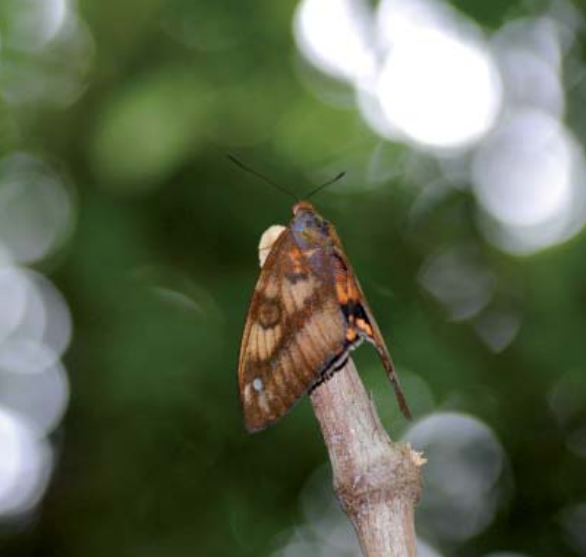
Castnia pinchoni perché à l'extrémité d'une branche sèche.