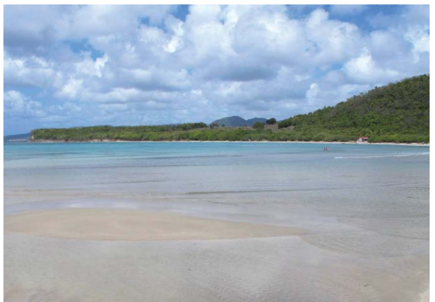
Plage à sable blanc des Salines (Commune de Sainte-Anne).