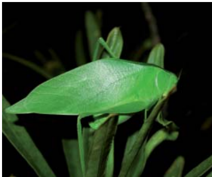
Microcentrum triangulatum .

des. Le chant des mâles est destiné à attirer les femelles. Ils rejoignent ensuite ensemble un lieu de ponte où seront déposés 10 à 30 œufs transparents recouverts d'un mucus protecteur. En sortiront, semblables à leurs parents, de minuscules grenouilles marron-gris, au dos décoré de deux chevrons foncés.