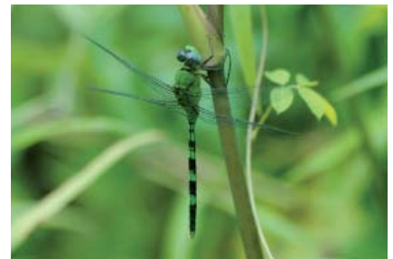
Erythemis vesiculosa (Libellulidé)

Moins remarquables par leur taille qui ne dépasse pas 1,5 cm, de nombreuses petites abeilles solitaires (mégachiles, halictes...) s'activent frénétiquement à la récolte du pollen et du nectar de diverses plantes des plages, des forêts littorales et des mornes rocheux. Ces derniers, souvent d'origine volcanique, témoignent d'un dynamisme éruptif lointain. Ils supportent une