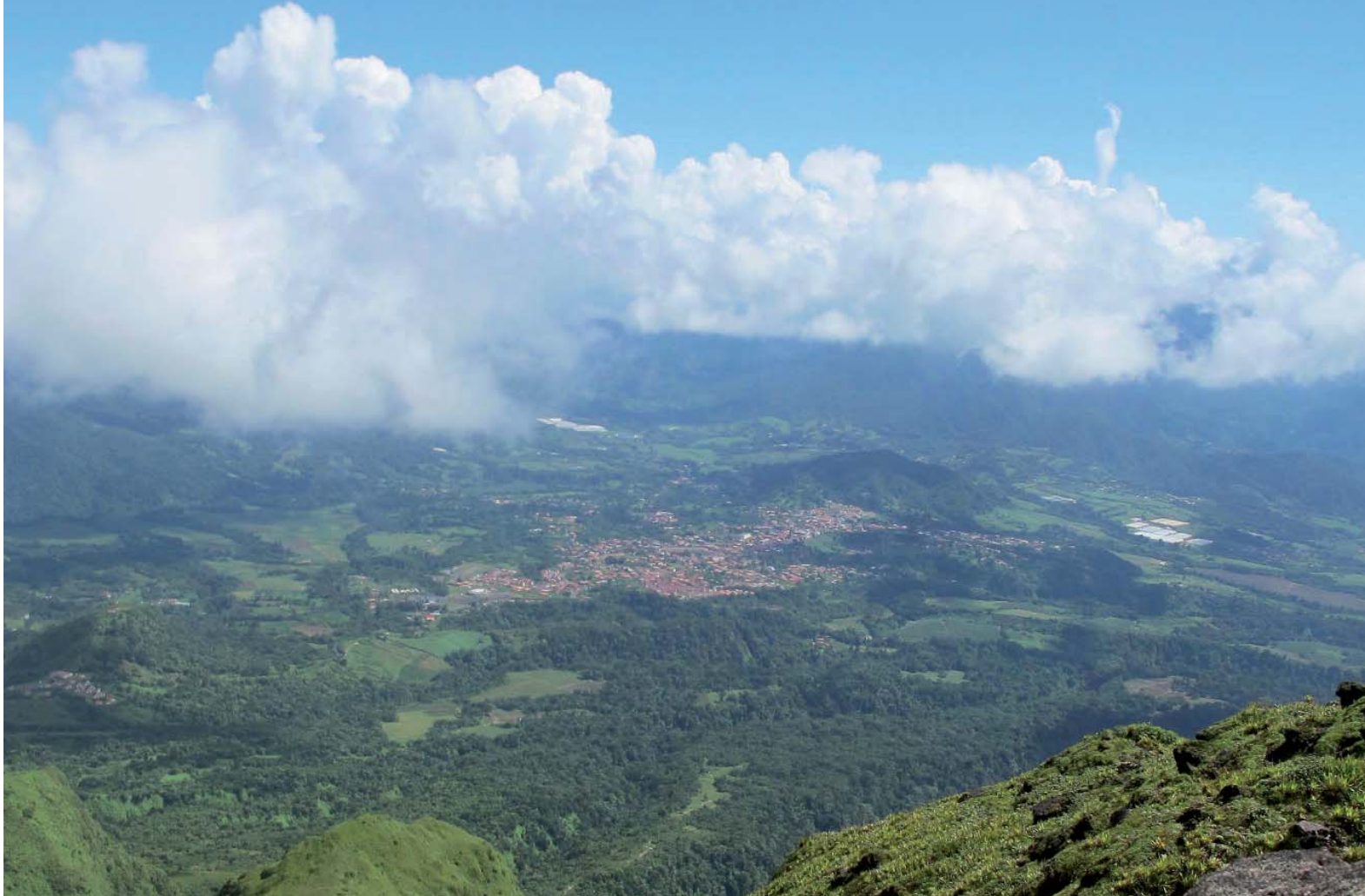
Paysage vu depuis le « Chinois » (Montagne Pelée, 1 395 m d'altitude).

Par Chloé Pierre et Eddy Dumbardon-Martial