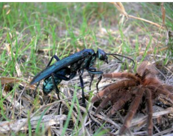
En haut, Vonvon femelle en pleine activité de butinage d'une fleur d'un « pois bâtard » ( Centrosema virginianum , Fabacée). En bas, une « Mouche brûlante » sur le point d'infliger à sa proie ( Acanthoscuria antillensis ) une piqûre paralysante.

par sa taille et la couleur bleu-noir métallique de son corps, passe une bonne partie des journées chaudes et ensoleillées à chercher au sol ces fameuses mygales qu'elle capturera pour nourrir ses larves.