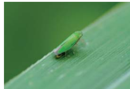
Hortensia similis .

Peut-être pour avoir de quoi préparer ces mixtures protectrices contre d'éventuels sortilèges (quimbois) largement utilisées autrefois dans les