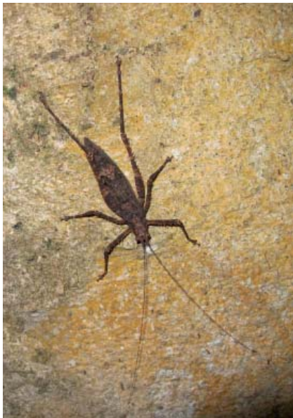
Mâle adulte d'un kabrit-bwa.