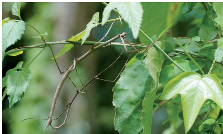
Accouplement de Paraphanocles keratoskeleton .

Il est toutefois difficile de rivaliser, en termes de déguisement, avec les phasmes (ou « chouval bon die » en créole) en forme de brindille qui se confondent aisément avec les rameaux des arbres. Il est plus aisé de les observer en forêt, la nuit, à la lumière d'une torche, lorsqu'ils se déplacent sur leurs plantes hôtes pour se nourrir et se reproduire. Ainsi, bien qu'aptères, les mâles de Paraphanocles keratoskeleton et de Clonistria , motivés par l'envie pressante de rencontrer une de leurs femelles, parcourent chaque soir de grandes distances à travers les forêts et les jardins pour assouvir leur désir.