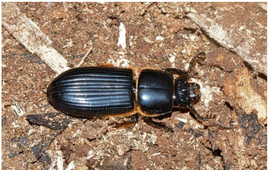
Passalus trinesides .

L'escalade du « Chinois » (1 395 m d'altitude environ) se termine par une sublime vue panoramique (voir en en-tête de cet article). Et en ce lieu, la montagne offre ce qu'elle a de meilleur : une mosaïque de paysages à ses pieds qu'elle a façonnés suite à ses éruptions successives. Sa dantesque colère péléenne du 8 mai 1902 a aussi eu raison des