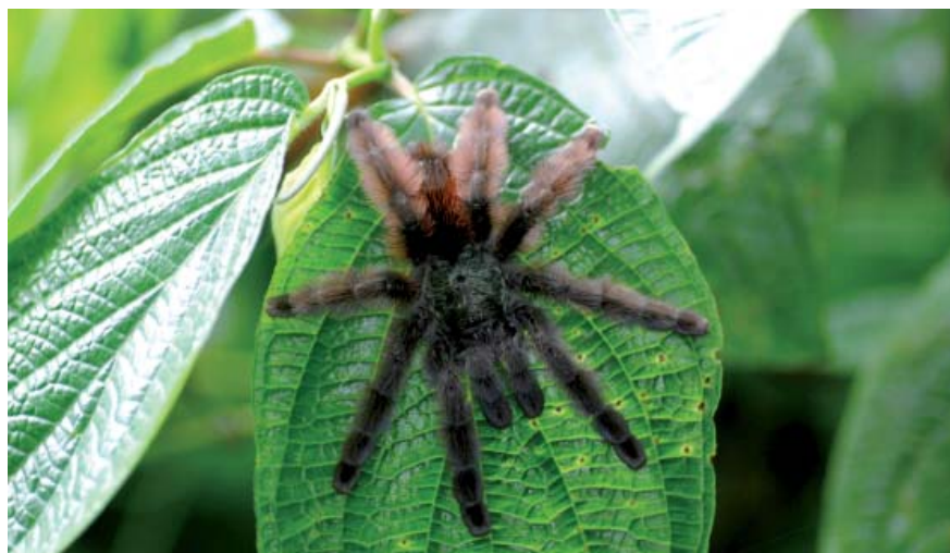
Matoutou falaise.