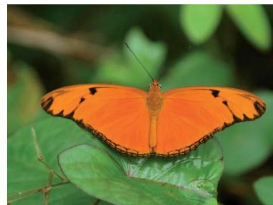
Le « Flamme ».

Récemment découvert dans ces lieux, Diapherodes martinicensis (Phasm. Phasmatidé) est longtemps passé inaperçu aux yeux des entomologistes. Remarquablement bien camouflé dans les épais houppiers des grands arbres, ce phasme endémique dont la biologie est encore