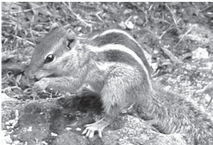
Figure 1. — Funambulus pennantii (morne Fleuri, mai 2007). La présence d'une raie claire entre le flanc et la première raie foncée est l'une des caractéristiques le plus directement apparente de cette espèce de funambule.

Si Wroughton (1905, 1916), suivi par Moore & Tate (1965), a distingué trois sous-espèces ( pennantii , argentescens et lutescens ), au sein de F. pennantii , sur la base de la coloration dorsale, la validité de ces sous-espèces a été controversée (e.g. Agrawal & Chakraborty, 1979),