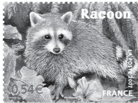
Figure 3. — Le timbre du Racoon (Raton laveur de la Guadeloupe) émis en avril 2007 par la Poste française.

En avril 2007, la Poste française a émis une série de timbres consacrée aux espèces protégées d'Outre-Mer et le Raton laveur de la Guadeloupe, sous son appellation locale de « Racoon », a été l'une des espèces choisies (Fig. 3). Les mesures réglementaires, comme l'image officielle donnée à cet animal, devraient être reconsidérées en prenant en compte le fait qu'il s'agit sans équivoque d'une espèce introduite et abondante dans sa très vaste aire de répartition initiale. Si l'Agouti doré, du fait de son introduction très ancienne et de son actuelle rareté en Guadeloupe, constitue un cas particulier qui peut justifier son statut actuel, il nous semble qu'il serait également nécessaire de reconsidérer le statut de l'Opossum commun Didelphis marsupialis à la Martinique, intégralement protégé sous cette dénomination par un autre arrêté du 17 février 1989.